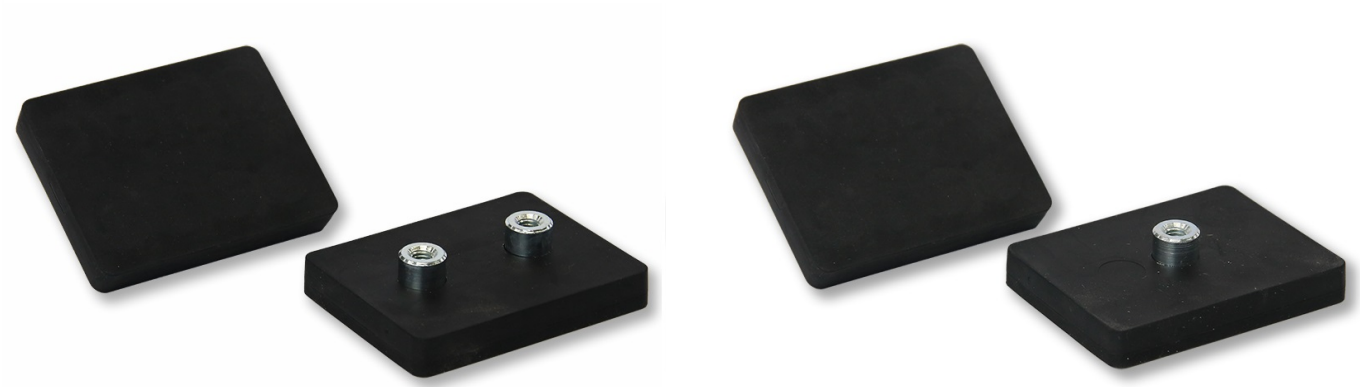
Sistemi magnetici con guaina in gomma a forma quadrata, nuclei magnetici in NdFeB